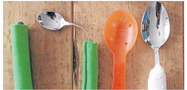
Cucharas adaptadas para terapias específicas. MARTA MARÍN

Los terapeutas reivindican el reconocimiento de su labor y exigen más puestos de trabajo y su presencia en los colegios